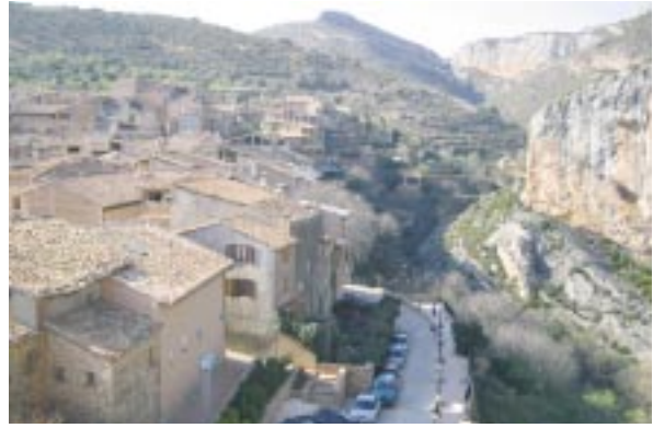
Vistas de Alquézar desde la Colegiata.