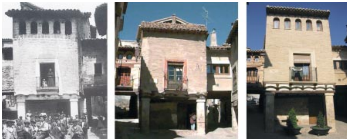
La Plana. Comparación. 1907, 2002 y en la actualidad

corporación local han sido escrupulosas en el cumplimiento de los criterios básicos de restauración que se pretendían exigir en las intervenciones promovidas por los vecinos.