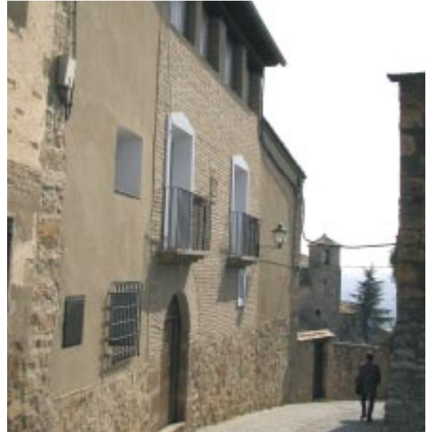
Casa de la Arilla. Comparación